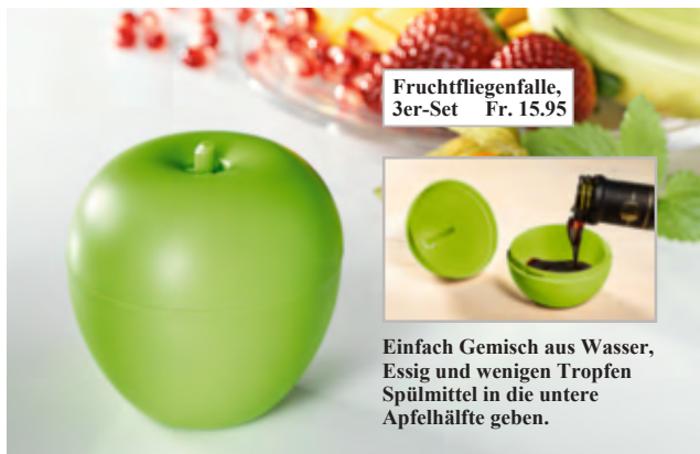
Fruchtfliegenfalle, 3er-Set Fr. 15.95

Einfach Gemisch aus Wasser, Essig und wenigen Tropfen Spülmittel in die untere Apfelhälfte geben.