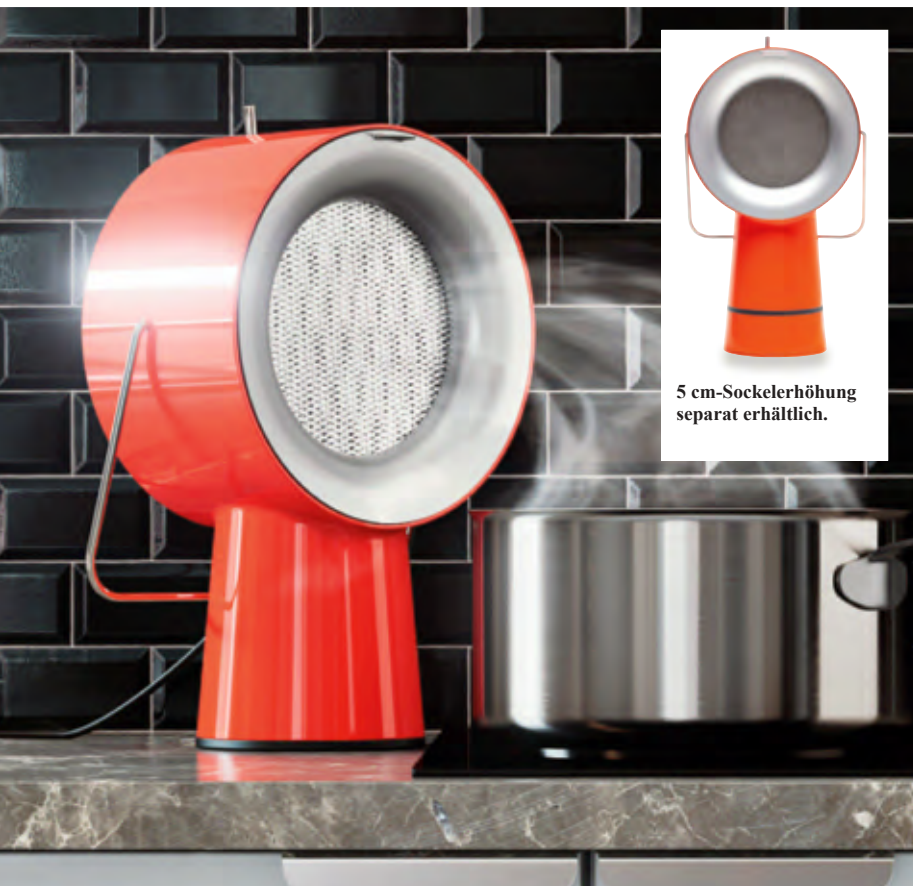
5 cm-Sockelerhöhung separat erhältlich.

Nutzen Sie Ihre Universaltücher zum streifen- und rückstandsfreien Reinigen von Spiegeln, Fenstern, Chrom und Edelstahl. Für Kunststoff, Autolack, Armaturen, Bildschirme, Fliesen. Im Trockeneinsatz ideal als Geschirr-, Polier- und Staubtuch.