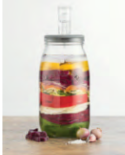
Dank des Gärventils im luftdichten Deckel entsteht kein Überdruck im Glas – für perfektes Gelingen Ihrer Delikatessen.