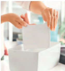
Handliche kleine Brotbox mit verstellbarer Trennwand – ideal zur Aufbewahrung unterschiedlicher Backwaren nebeneinander.

bzw. Rand der Box mit einer CondensControl™-Membran ausgestattet. Zusätzlich lässt das Rillenprofil am Behälter- boden Luft auch um die Unterseite Ihrer Backwaren zirkulieren. So entsteht ein ideales Aufbewahrungsklima, das Schimmelbildung vorbeugt und gleichzeitig bewirkt, dass Ihre Backwaren nicht so schnell austrocknen und hart werden. Brot und Brötchen, Baguette, Muf- fins, ... schmecken länger köstlich frisch. Sie müssen kein Brot wegwerfen, nichts wird verschwendet.