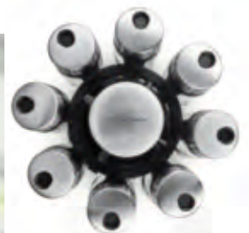
Dosieren, streuen, rieseln Sie: die Verschlusskappen sind 3fach verstellbar.