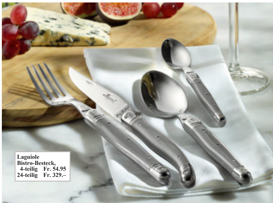
Laguiole Bistro-Besteck, 4-teilig Fr. 54.95 24-teilig Fr. 329.-