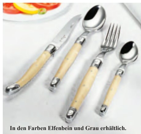
In den Farben Elfenbein und Grau erhältlich.

Die Messer sind ca. 23 cm lang – das 4-teilige Set mit Messer, Gabel, Ess- und Teelöffel – wiegt ca. 230 g. Spülmaschinen geeignet.