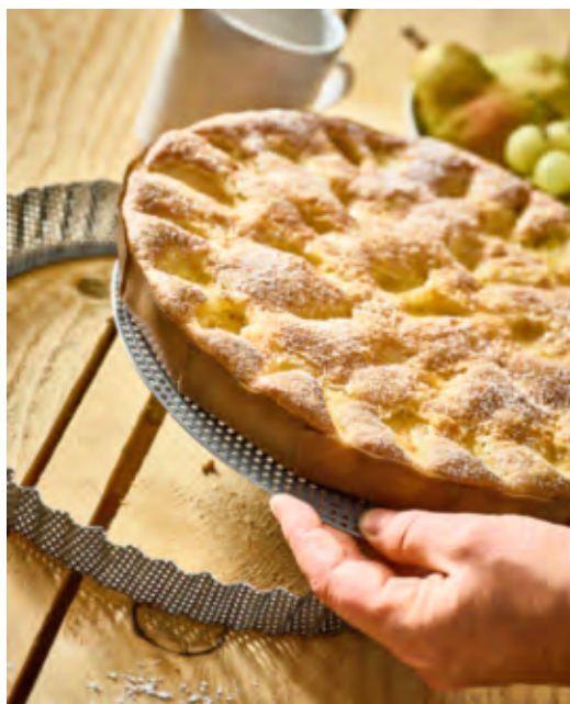
Zerbrechliche Tartes nehmen Sie einfach mit dem lose einliegenden Boden aus der Form.

Inklusive passgenauer Antihaft-Backfolie zum Einlegen.