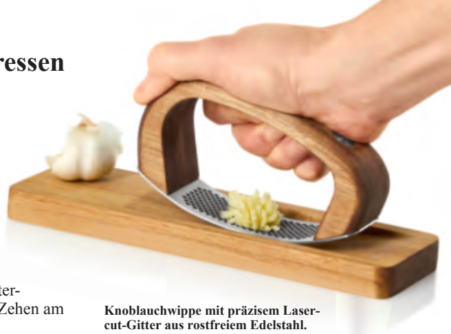
Knoblauchwippe mit präzisiertem Laser-cut-Gitter aus rostfreiem Edelstahl.

• AdHoc® Knoblauchwippe mit Schneidbrett Nr. 236-622-06 Fr. 56.95