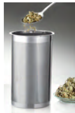
Der doppelte Mikrofilter aus Edelstahl ist fein genug sogar für losen Blatttee.