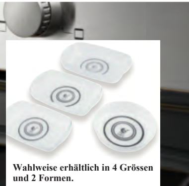
Wahlweise erhältlich in 4 Grössen und 2 Formen.

Hersteller: TVS SpA, Via Gallileo Gallilei 2, 61033 Fermignano, IT, customer.service@tvs-spa.it