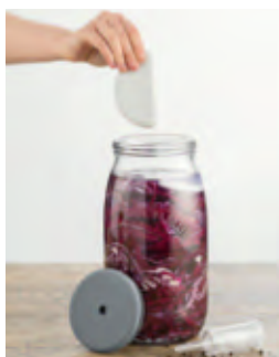
2 praktische Gewichte zum Beschweren des Fermentierguts im Lieferumfang enthalten.