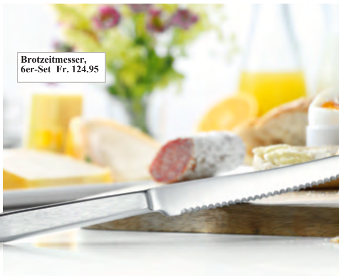
Brotzeitmesser, 6er-Set Fr. 124.95