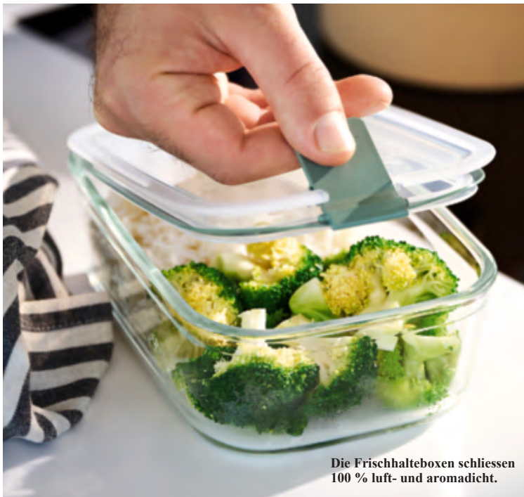
Die Frischhalteboxen schliessen 100 % luft- und aromadicht.

Mit patentiertem Deckelclip und Dampfventil für die Mikrowelle. 100 % luft- und aromadicht sowie garantiert auslaufsicher. Kein Vergleich zu den schwergängigen Rundum-Klick-Ver-