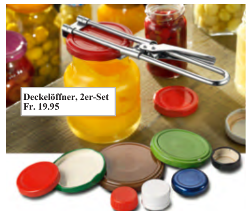
Deckelöffner, 2er-Set Fr. 19.95