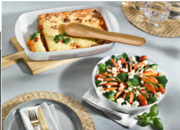
Die edel weissen Glasformen sind perfekt auch zum Servieren auf dem Tisch.

Kein Vergleich zu herkömmlich beschichteten Ofenformen. Die patentierte Keramik-Beschichtung dieser Borosilikatglas-Formen hat eine 50 % höhere Antihafteffizienz, ist 60 % abriebfester und 300 % (!) spülmaschinenfester als alle Vorgänger-Generationen vom italienischen Marktführer für Antihaft-Kochgeschirr, TVS.