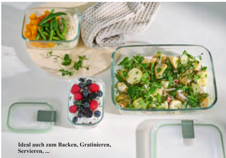
Ideal auch zum Backen, Gratинieren, Servieren, ...

In fünf Einzelgrössen und zwei 3er-Sets erhältlich.