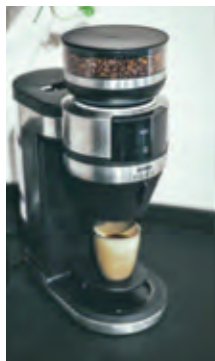
Mit höhenverstellbarem Halter für Einzeltassen.