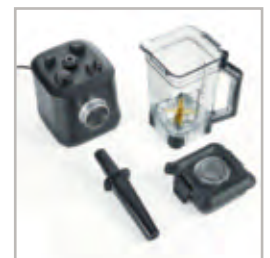
Komplett mit 2 l-Tritan®-Mixbehälter, 8-fach Messer-System, Deckel mit intelligentem Sicherheitsverschluss, Stößel und rutschfestem Sockel.