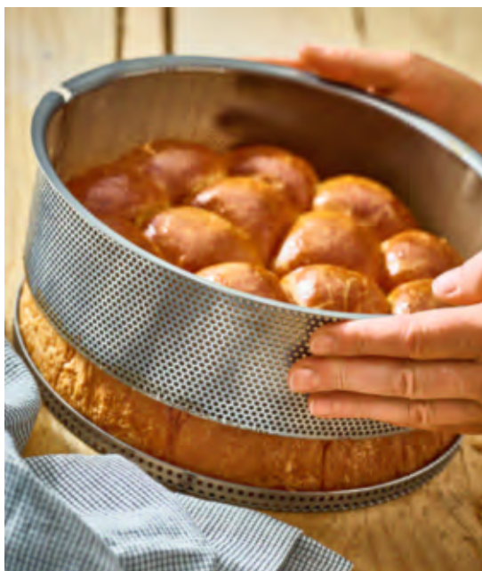
Den Ring der Kuchenform können Sie ganz bequem vom separaten Lochboden abheben.