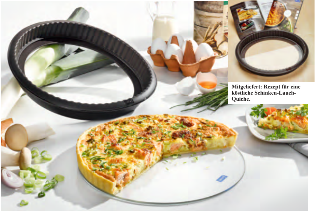
Mitgeliefert: Rezept für eine köstliche Schinken-Lauch-Quiche.