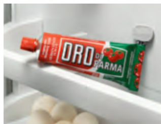
In flachen Ablagefächern lagern Sie die Tuben einfach ohne die mitgelieferten Standfüsse.