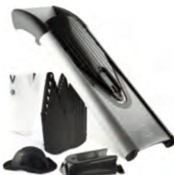
V-Gemüsehobel-Set bestehend aus Hobel, Messereinsätzen, Messereinschub, Sicherheitseinschub, Dockingstation.