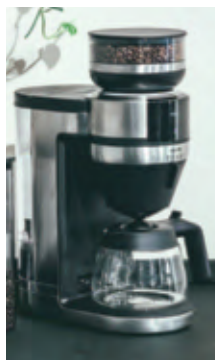
Wahlweise auch mit Glaskanne erhältlich.

Doppelwandiger 350 ml-Thermobecher to go aus Edelstahl separat erhältlich.