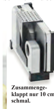
Zusammenge- klappt nur 10 cm schmal.

Kein Rucken, kein Reissen: Butterweich schneidet das Wellenschliffmesser selbst harten Käse und extra knuspriges Brot in akkurate Scheiben. Für extra feine Schnitte von weichem und empfindlichem Schneidgut ist das glatte Schinken-/Aufschnittmesser optimal. Sehr gut geeignet für Roh- und Kochschin- ken, Wurst, Gemüse-Carpaccio, ... Auch Rouladen und Scaloppine gelingen gleichmässig und glatt wie vom Metzger. Schnittstärke (bis ca. 14 mm) stufenlos einstellbar.