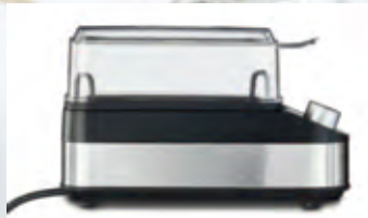
In elegant mattiertem Edelstahl-Design – pflegeleicht und dauerhaft schön.