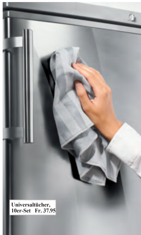
Universaltücher, 10er-Set Fr. 37.95

Hinweis: Nicht in Kombination mit einem Gasherd oder in der Nähe von offenen Flammen verwenden.