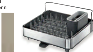
Zusammengeschoben ideal für den kleinen Abwasch: mit kompakter Grundfläche von 36,4 B x 32 T cm.

• Ausziehbarer Abtropfkorb Nr. 230-761-06 Fr. 79.95