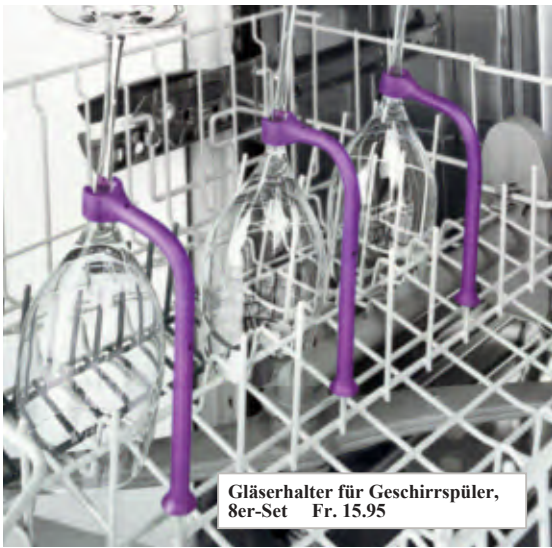
Gläserhalter für Geschirrspüler, 8er-Set Fr. 15.95