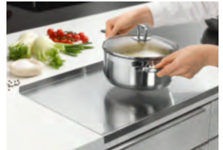
Perfekt auch zum Abstellen des heissen Backblechs oder Kochtopfs, ...