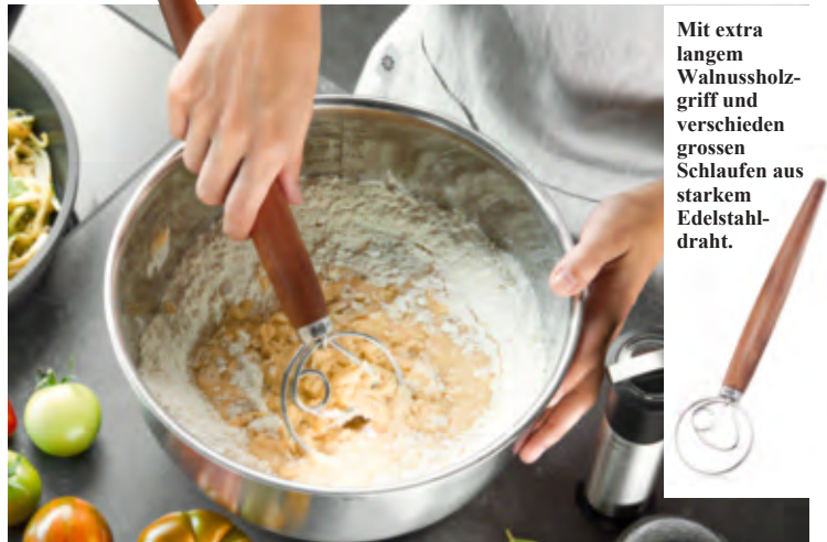
Mit extra langem Walnussholzgriff und verschiedenen grossen Schlaufen aus starkem Edelstahl-draht.