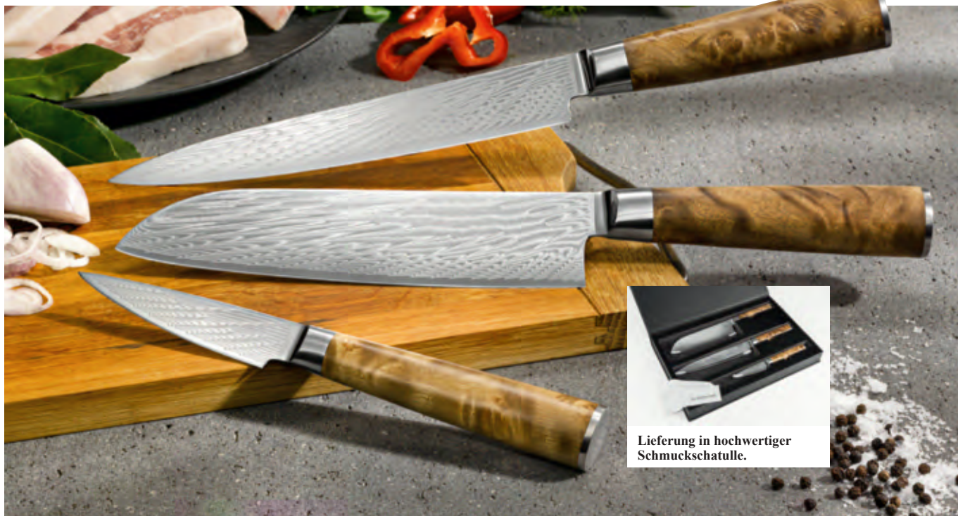
Lieferung in hochwertiger Schmuckschatulle.