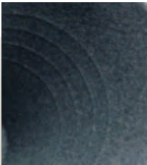
Mit Wandmarkierungen innen für 1 – 4 Tassen.