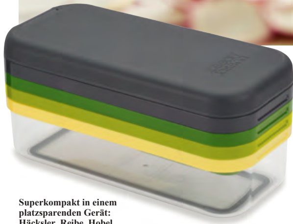
Superkompakt in einem platzsparenden Gerät: Häcksler, Reibe, Hobel, Julienne-Schneider, Restehalter, Auffangbehälter.