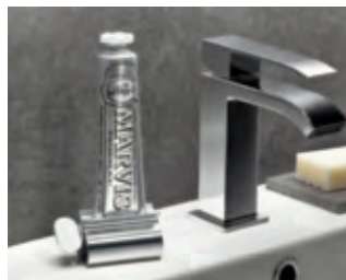
Ideal auch für Zahncreme, Ölfarbe, teure Salben, ...