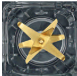
Das 8-flügelige Messerwerk meistert schnell und mühelos selbst hartes und fasriges Mixgut.

Keine unverarbeiteten Reste am Behälterboden. Kein Klümpchen, keine Faser stört den Genuss.