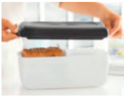
Grosse Brotbox mit extra Rahmen und Deckel – perfekt für 1 grosses Brot oder mehrere Gebäckstücke.

Nicht zu feucht. Nicht zu trocken. Und stets ideal belüftet: Diese clevere Brotbox reguliert das Klima im Inneren ganz von allein und stimmt Luft- und Feuchtig- keitsgehalt optimal aufeinander ab. Dazu sind Deckel