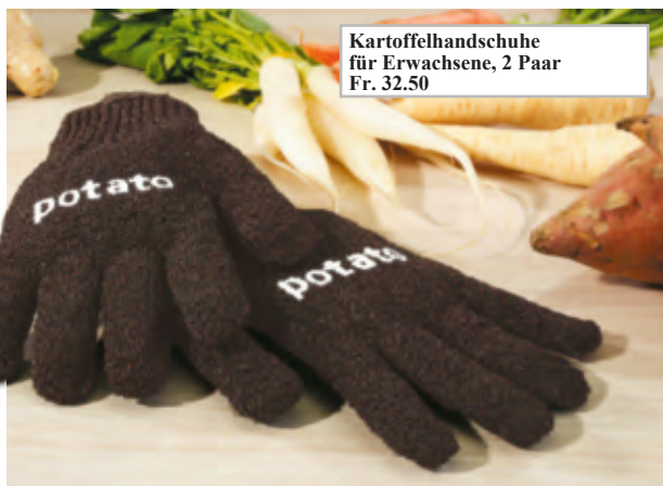
Kartoffelhandschuhe für Erwachsene, 2 Paar Fr. 32.50

Waschen Sie Karotten, Steckrübchen, Wurzelpetersilie, Äpfel, ... so einfach wie Ihre Hände.