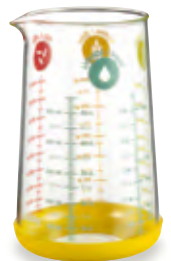
Wahlweise auch mit 500 ml Fassungsvermögen erhältlich.