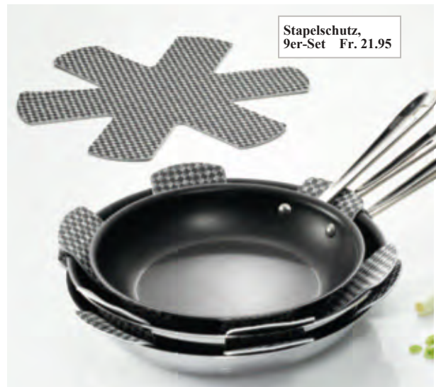
Stapelschutz, 9er-Set Fr. 21.95