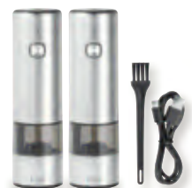
Wahlweise auch im 2er-Set erhältlich.